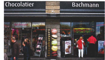
Brotzeit | Confectionery treats

as a sign that things are getting a little cramped in Lucerne. Hug recently opened a branch in the district of Wiedikon, Bachmann opened a new store at Sihlcity shopping centre in September