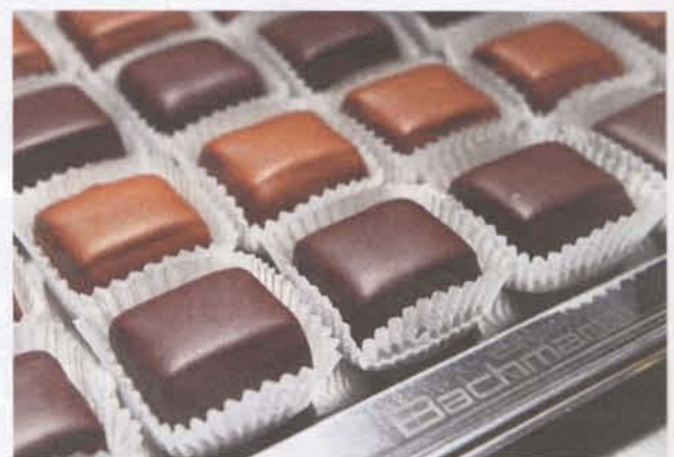
Rose D'Or Limited Edition Wasserturm Stein erhältlich ab 13. April in allen Bachmann-Filialen.